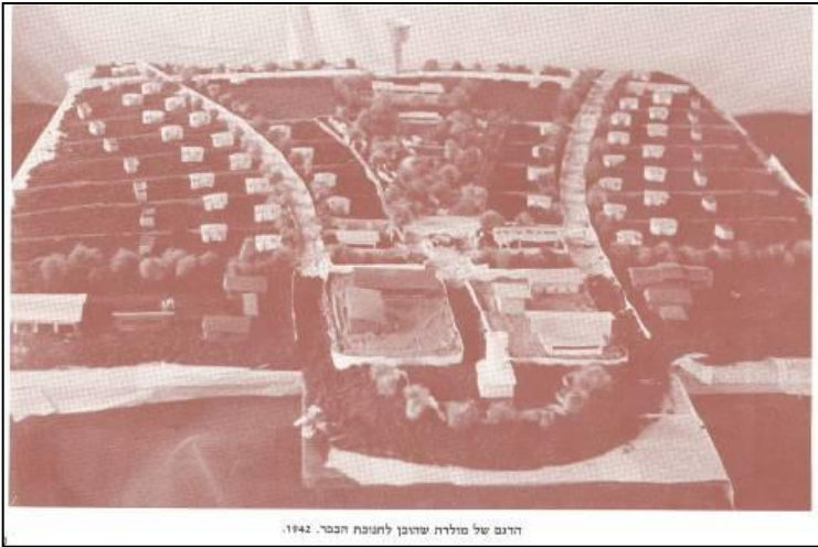
הרגום של מולדת שדוהבן לתנובת הכפר. 1942.