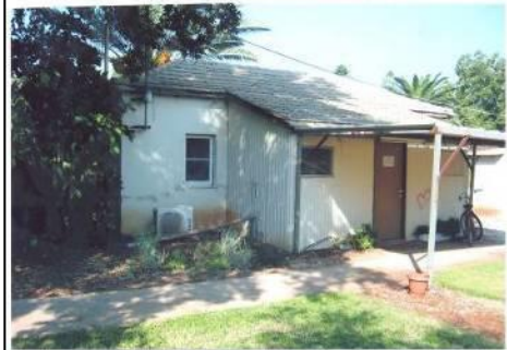
הבית הראשון כיום - משרד ענף גידולי שדה