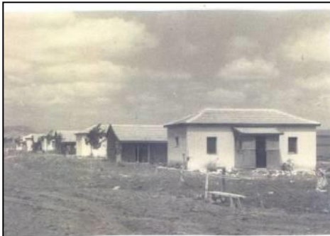
שורת בתי המגורים הראשונים, 1942